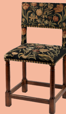
Atelier Van der Gucht