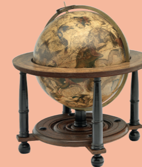
Willem Janszoon Blaeu